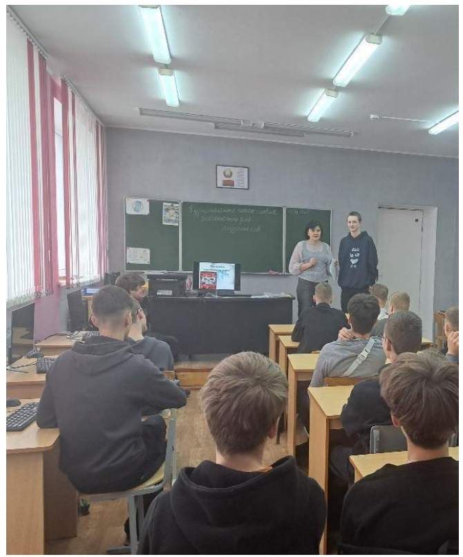
Мероприятие сопровождалось презентацией «Чем опасны курительные